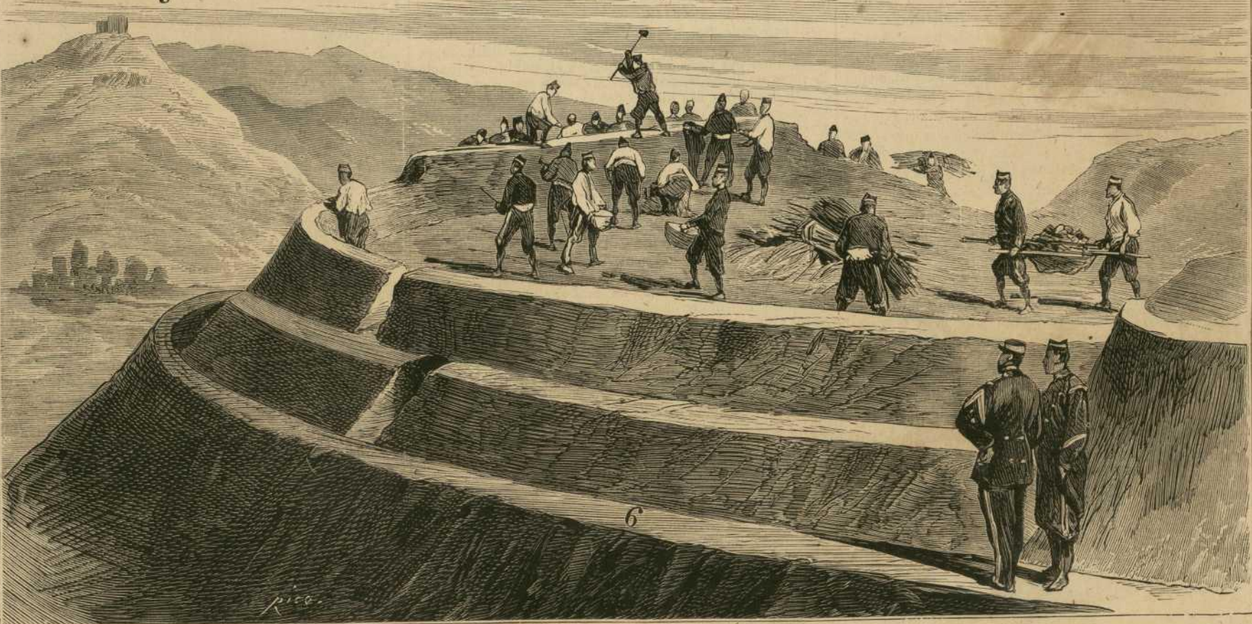
1. Logroño: Avanzadas del ejército en la orilla derecha del Ebro. — 2. Miranda de Ebro: Asistentes á la puerta de una taberna. — 3. Logroño: Soldados escribiendo una carta sobre una hornacina del convento de la Merced. — 4. Ternel: Miliciano nacional (croquis del Sr. Uguet). — 5. Miranda de Ebro: Entrada á la poblacion. — 6. Ingenieros fortificando el a' to de los Zorros, cerca de Miranda. ( Croquis del Sr. Rodriguez Tejero.)