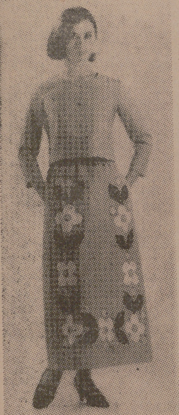
Original conjunto de chaqueta y falda larga, en grueso algodón. La falda, estampada, llega hasta el tobillo. Modelo italiano.