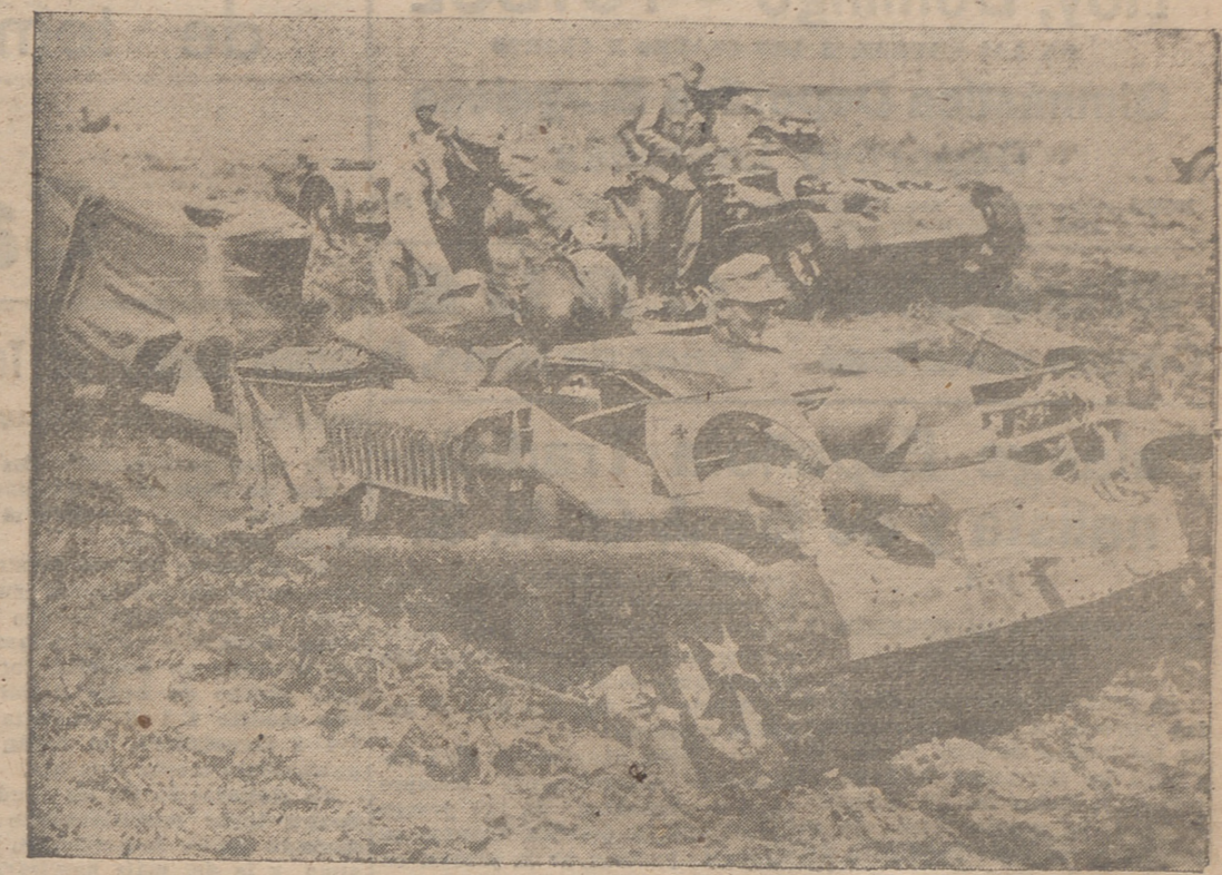
Las batallas de las tropas alemanas en el Delta del Don se hacen bastante dificultosas a causa del fango existente allí. Tampoco a los coches orugas les es posible el avance sin un gran número de esfuerzos, y en medio de todo, esto millones de mosquitos y moscas hacen todavía más imposible el avance.