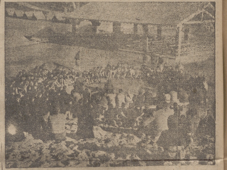
Animado aspecto de un Fuego de Campamento en Laga

—Aunque pensaba que los chicos nunca llegarían a suponer que lo estaban como lo están. Es una magnífica obra ésta de los Campamentos juveniles que merece toda clase de elogios. Por mi parte, y mientras la edad se lo permita, procuraré aprovecharme del beneficio de mis hijos, pues este cambio de aires, las actividades campamentales y la disciplina de los campamentos, son factores muy beneficiosos, y como todo ello es fácil de conseguir dadas las grandes ventajas económicas, morales y materiales que el Frente de Juventudes nos brinda, he de aprovecharlas.