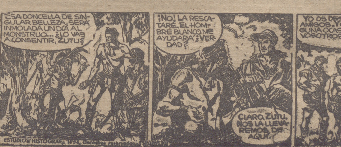
ESTUDIO HISTORICO, 1954. Dedicado a...