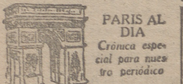
PARIS AL DIA Cronica especial para nuestro periódico