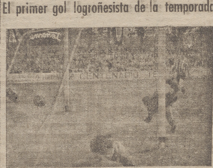
Por ser el primer gol logroñesista de la temporada, merece la publicación: Edu, pese a su estrada, no puede defender el chit ni corto de Anta.

JUVENIL CORUNA, 2. Alineaciones: Gijón: Sión, Ladreda, Altisén, Riondas; Medina Molinico; Pío, Ortiz, Paredes, Gálvez y Suárez.