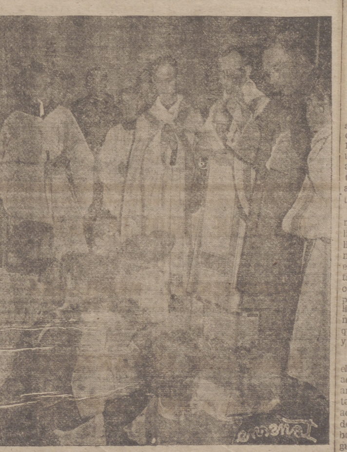
El Excmo. y Rdm. Sr. obispo de la diócesis y gran prior del Capítulo de Caballeros de Nuestra Señora de Valvanera en un momento de las solemnes ceremonias celebradas el domingo en el Monasterio de la excelsa Patrona de la Rioja, en las que recibieron la investidura cuatro nuevos Caballeros de la Orden valvaneriana. (Información en tercera página)