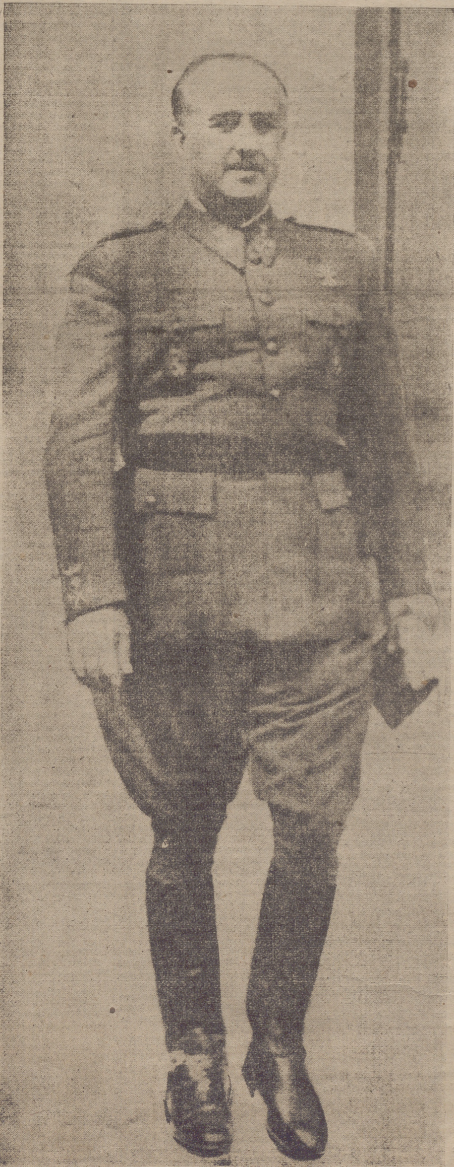
El general Franco, en los días en que asumió la Jefatura del nuevo Estado.