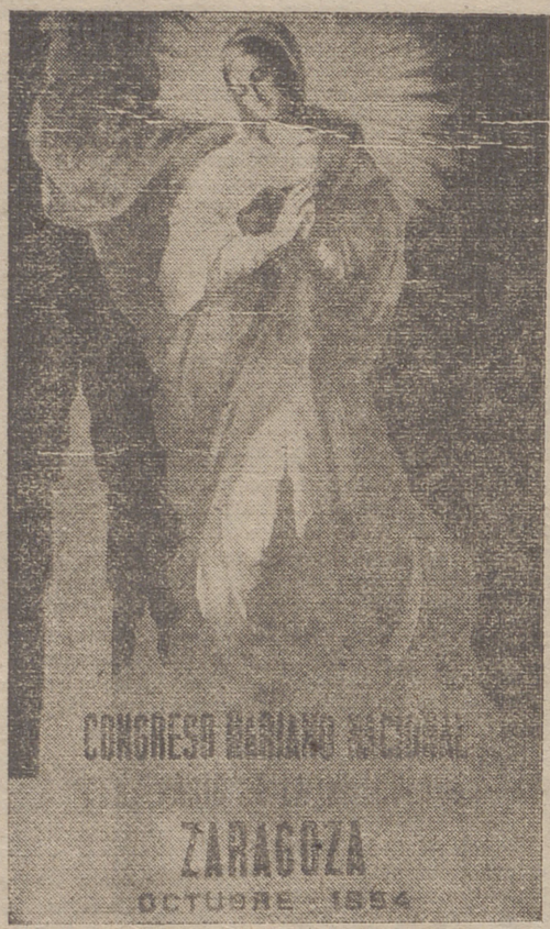
CONGRESO MARIANO NACIONAL EN ZARAGOZA OCTUBRE 1954

aje de la familia cristiana española a la Santísima Virgen y ofrenda del Libro de Oro del Rosario en familia en la Basílica del Pilar.