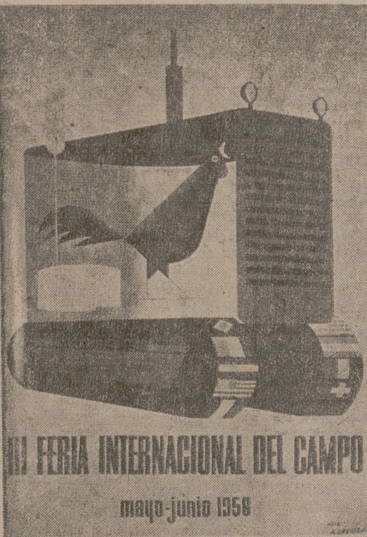
III FERIA INTERNACIONAL DEL CAMPO mayo-junio 1956

MADRID, 22.—Su Excelencia el Jefe del Estado, acompañado de su esposa, ha inaugurado la III Feria Internacional del Campo. La inclemencia del tiempo ha hecho que la visita del Generalísimo ha ya tenido que circunscribirse a determinados pabellones. Le dio la bienvenida a la entrada del recinto los ministros de la Gobernación, Industria, Comercio, Trabajo, Agricultura e Información Turística. Con ellos se encontraba el delegado y secretario nacional de Sindicatos, comisario general de la Feria del Campo, subsecretarios del Aire, Agricultura, Obras Públicas, Gobernación y Trabajo social y presidente de la Diputación de Madrid; capitán general gobernador civil y militar; los gobernadores de todas las provincias españolas con los jefes nacionales de Sindicatos, Obras y Servicios, así como un gran número de embajadores, entre los que se hallaban los de Estados Unidos, Colombia y Paraguay.