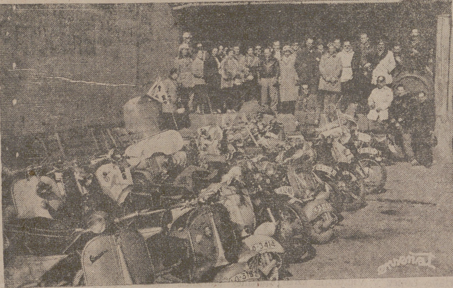
Los motociclistas logroñeses, a la puerta de "Bodegas Lagunilla", con sus máquinas aparcadas ante la fachada.

El pasado domingo se celebró la excursión final a Cenicero, cuyos alicientes eran más que sobrados para presumir que la participante iban a ser muy numerosos, pero, en verdad, ya en el lugar de salida se concentraron cerca de medio centenar de máquinas.