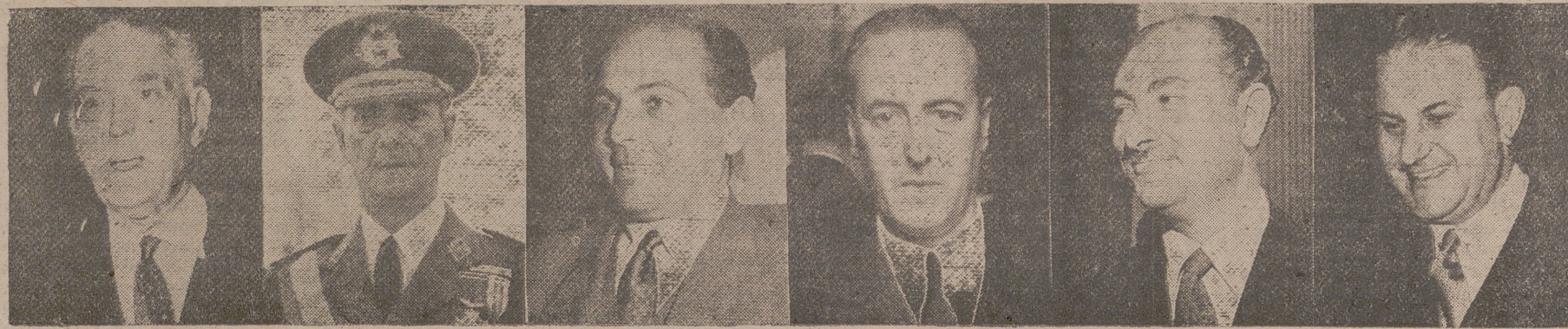
Don Pedro Gual Villalbi Don José Rodríguez y Díaz de Lecea Don José Sois Ruiz Don Fermín Sanz Orrio D. Mariano Navarro Rubio Don Fernando M.ª Castiella y Mañá

MADRID, 26.—A las once de esta mañana se celebró, en el Palacio de El Pardo, el solemne acto del juramento de sus cargos por los nuevos ministros del Gobierno español. La ceremonia se celebró en el despacho de Su Excelencia el Jefe del Estado. Acompañaban al Caudillo el jefe de su Casa Civil, segundo jefe de la Casa Militar, segundo jefe e intendente de la Casa Civil y ayudantes de campo de Su Excelencia. Actuó como notario mayor del Reino el ministro de Justicia, señor Irujo, y el juramento lo efectuaron los ministros por el siguiente orden: