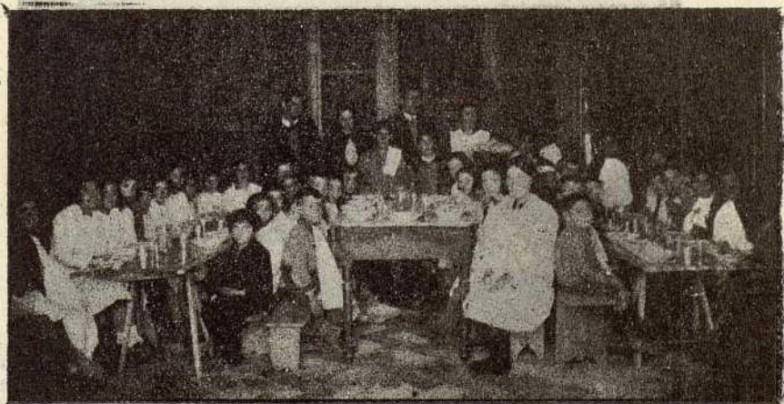
En diversos pueblos de la provincia siguen funcionando, con éxito creciente, las Cantinas Escolares. He aquí un momento de los niños de Briones, disfrutando de sus beneficios