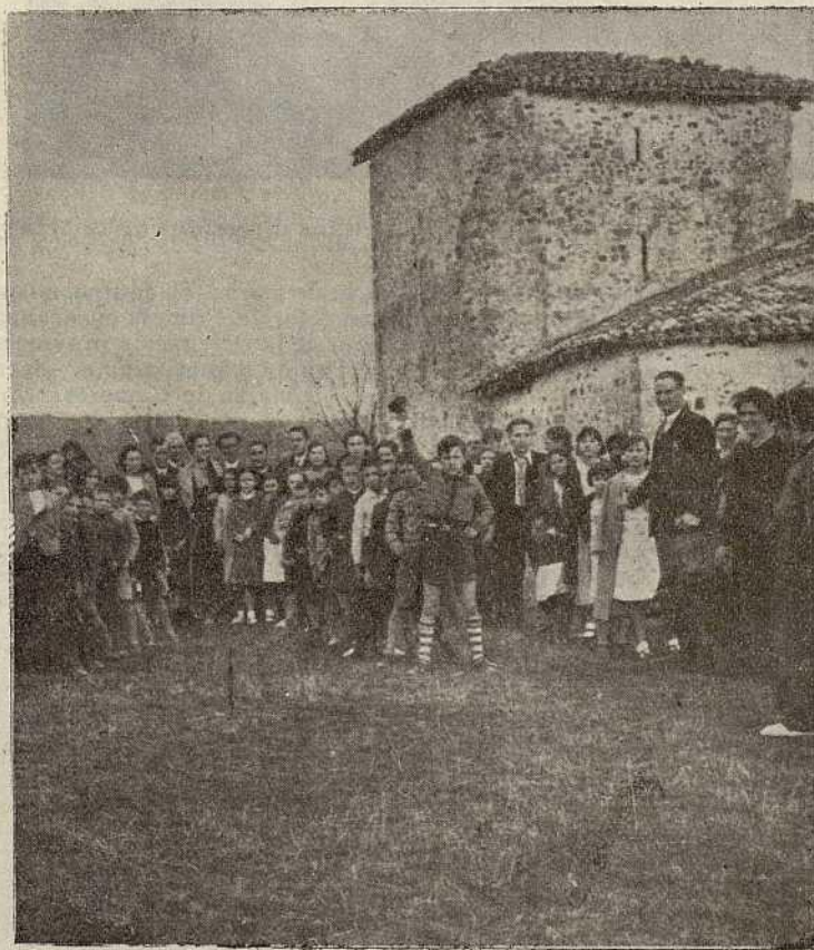
Los niños de Lumbreras, San Andrés y Pajares, ensayan los juegos educativos de la Misión