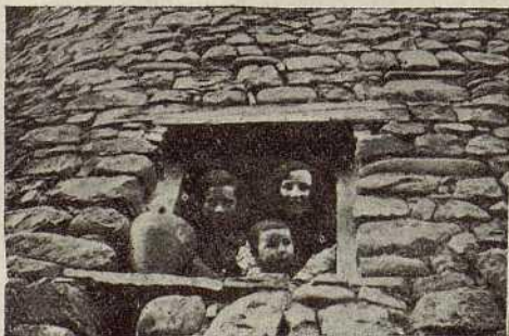
El paso de la Misión