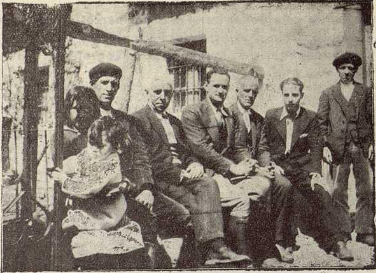
Las autoridades de Pajares conversan con los dirigentes de la Misión