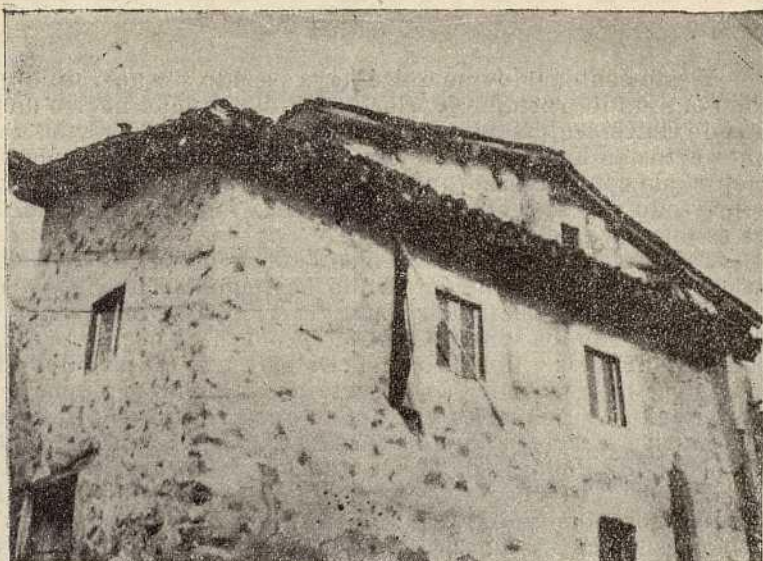
La Escuela mixta de Gallinero de Cameros, cuyo centenario se ha conmemorado con una Misión Pedagógica

Quiero glosar un centenario que no es uno más en la ya larga lista de efemérides, sino que es, al menos a mí me lo parece, un centenario distinto de los demás, fuera de la riada de fechas, jalón marcador por sí sólo de varios centenarios.