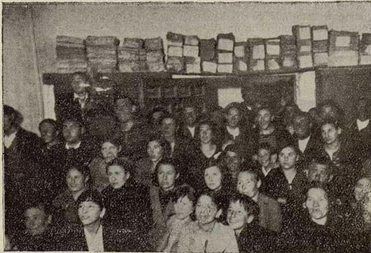
El público de Lumbreras ante las proyecciones cinematográficas

ALDEANUEVA DE CAMEROS. Día 27. Después de hora y media de camino, llegamos a Aldeanueva, acompañados ya por el señor Mar-