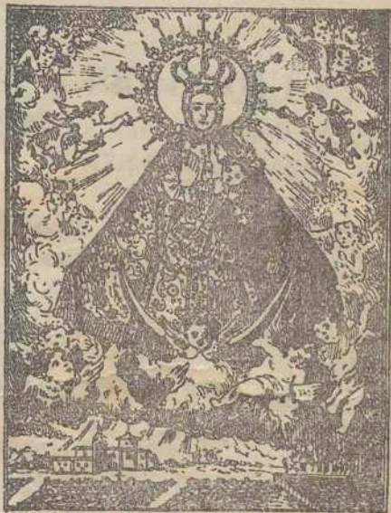
Ntra. Sra. de Dabalillo.