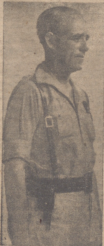
EL NUEVO MINISTRO DEL EJERCITO, GENERAL ASENSIO CAVANILLAS

Durante toda nuestra guerra de liberación se distinguió extraordinariamente por su valor, competencia y dotes de mando. Ha sido Alto Comisario de España en Marruecos; es Consejero Nacional de Falange Española Tradicionalista y de las J. O. N. S. y actualmente desempeña la Jefatura del Estado Mayor Central.