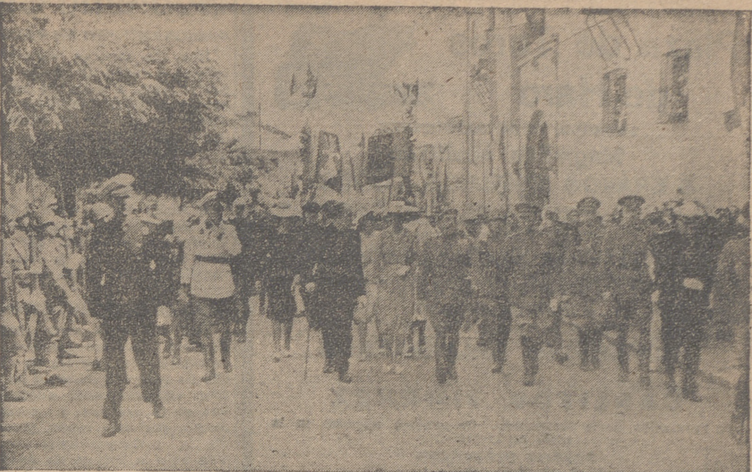
S. E. EL JEFE DEL ESTADO, GENERALISIMO FRANCO, LLEGA A LEON, DONDE ES OBJETO DE UN ENTUSIASTA RECIBIMIENTO.