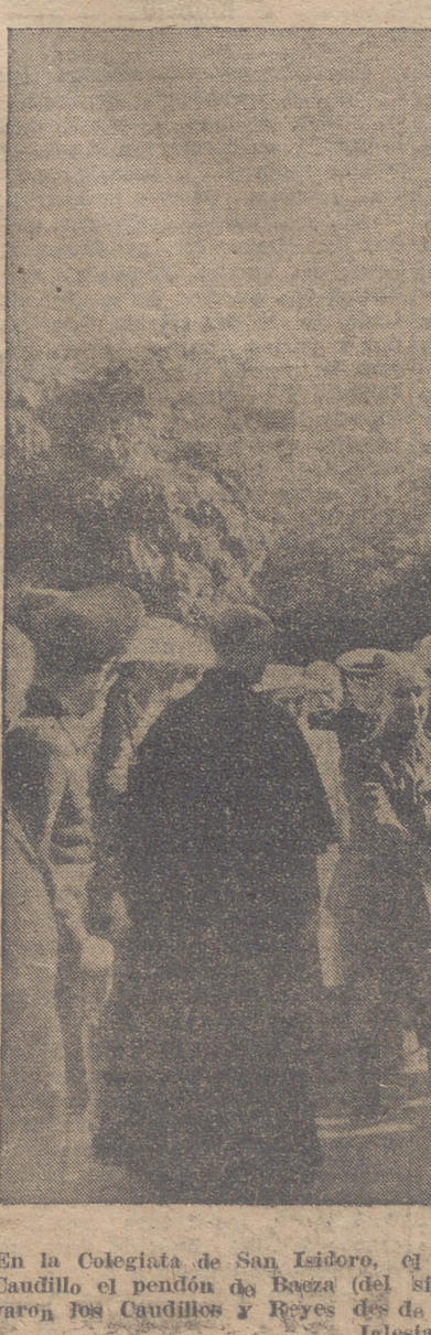
En la Colegiata de San Isidro, el Abad y el Alcalde entregan al Caudillo el pendón de Baza (del siglo XII), que solamente lo llevaron los Caudillos y Reyes de la verja de la Colegiata a la Iglesia.