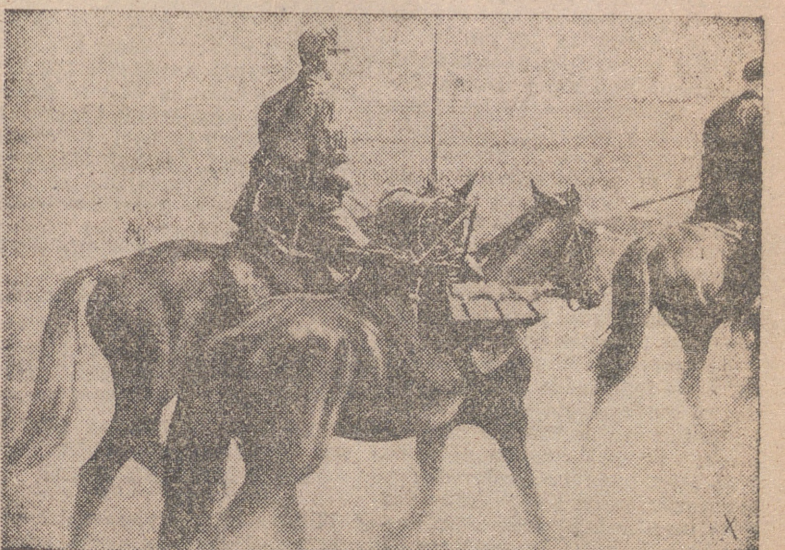
Unidades de Caballería del servicio alemán de transmisiones recorren el territorio de las líneas telefónicas de campaña para reparar sus averías. Estas son localizadas rápidamente con el auxilio de un teléfono que se transporta sobre el mismo caballo.