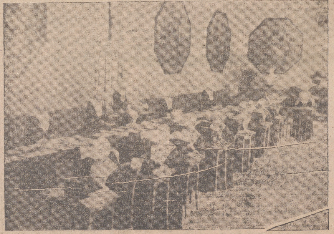
Los Hermanos de la Caridad redactan en la Oficina de Información cartas de contestación para las familias de los combatientes prisioneros en territorio enemigo.

de las localidades donde haya sido abierta la suscripción «Pro reconstrucción del Monumento al Sagrado Corazón de Jesús...»