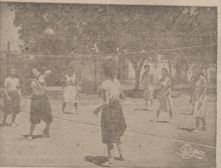
Momento de uno de los partidos celebrados en este campeonato de balón-volea

Días pasados se celebró en nuestra capital, un partido de balón-volea entre los equipos de Sección Femenina y Servicio Social, para pasar a la prueba provincial aquel que quedara campeón local.