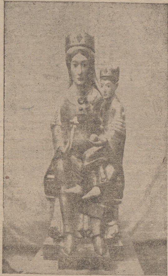
Hoy y mañana celebra Nájera, la ciudad riojana de tan noble solera espiritual y tan glorioso pasado histórico, sus grandes fiestas tradicionales.

Pero aquellos «avores del rey Don García desaparecieron muy pronto con su muerte prematura en la batalla de Alapuzca. El día 1 de sep- tiembre del año 1054 se corta su vida en lucha con su hermano el rey de Castilla, y la vida de esta magna institución. Su hijo y herede- ro del Reino de Navarra Sancho el de Peñalén, tomará con cariño las cosas del Reino de Navarra y el recuerdo agradecido de su padre le hará vivir estos intereses espiri- tuales de su padre pero la desgra- cia y muerte traidora que su her- mano don Ramón le da en las ca- lcerías de Peñalén vuelven definiti- vamente a hacer desaparecer aquel nombre de la Terraza para siempre, aunque sea el símbolo predilecto de