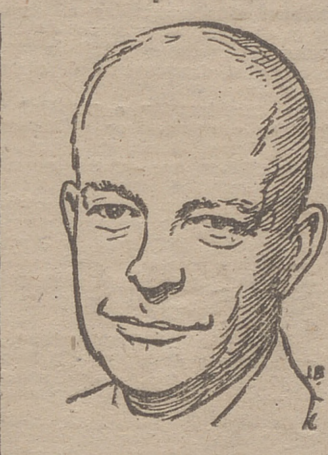
Mr. Dwight Eisenhower, presidente de los Estados Unidos de América

Rusia había indicado ya su deseo de que Pekín tomase parte en la proyectada reunión de los grandes y los occidentales lo rechazaron.—(Efe).