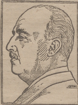
Don Francisco Franco Bahamonde, Jefe del Estado Español y Generalísimo de sus Ejércitos

También en primera plana dice «La Nación»: «España y Estados Unidos, aliados en un tratado que los une por primera vez. Ambos países harán frente a la agresión de las fuerzas rojas».—(Efe).