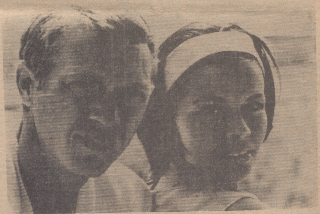
El popular actor norteamericano Steve Mac Queen se está quedando sordo a consecuencia de su afición a los bólidos de carreras y a los ruidos estridentes. Al parecer, el actor ha sufrido ya graves trastornos auditivos