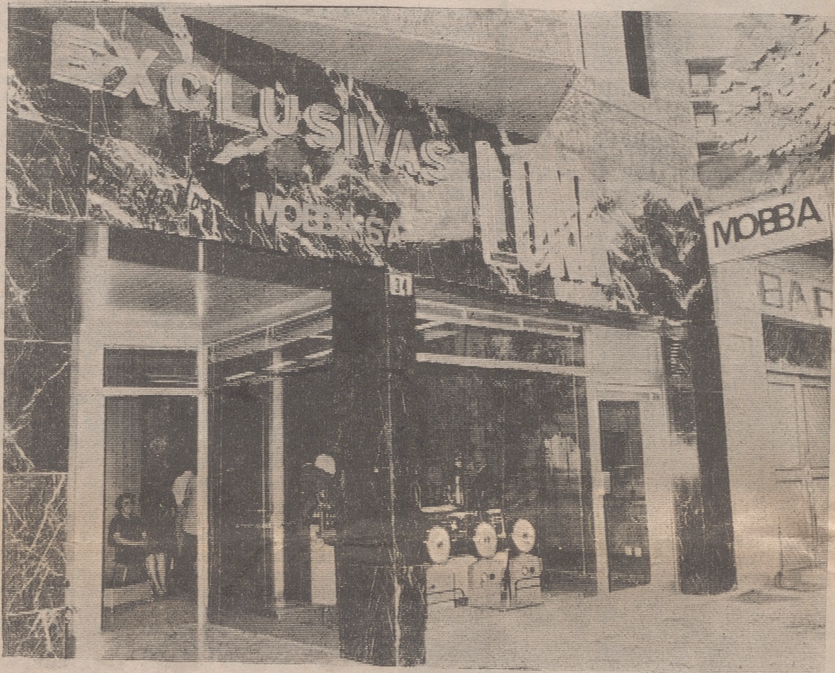
Panorama que ofrece la fachada principal

DE SUS NUEVOS LOCALES SITOS EN AVDA. PORTUGAL, 34