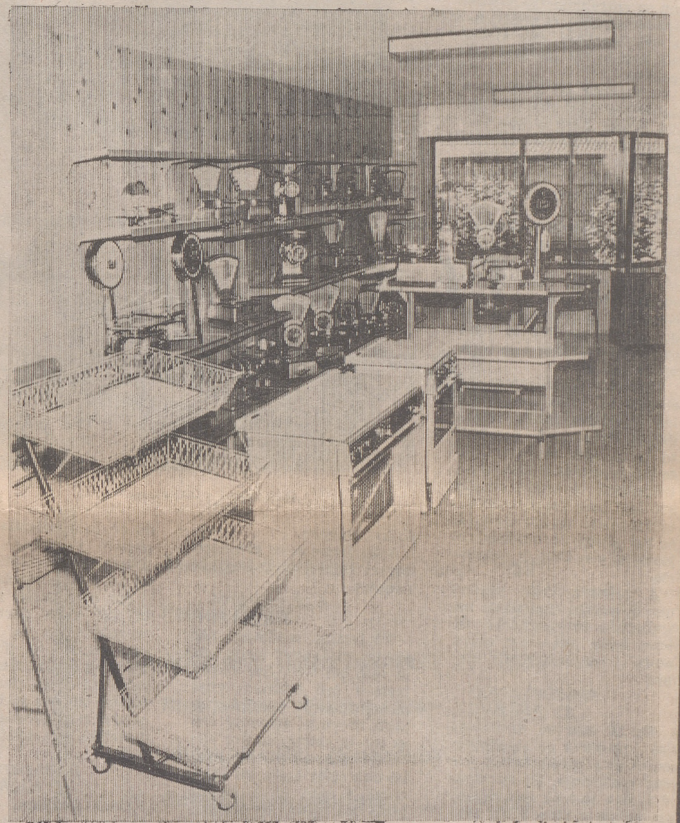
Maquinaria a su servicio