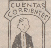
Current accounts «kæren acáunts»