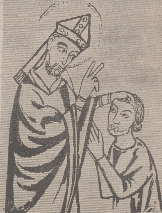
(REPRODUCCIÓN DE UNA PINTURA MURAL)

Y no es aventurado predecir que, sin tardar mucho, se celebre en Nájera la primera Asamblea.