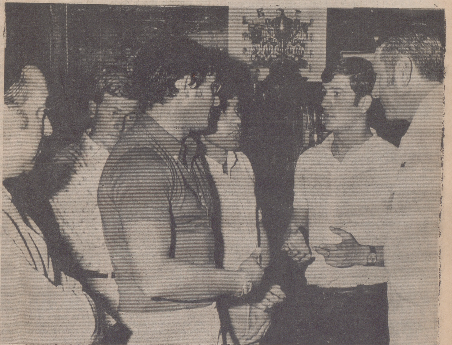
Anoche, en el domicilio social del Deportivo, se hizo la presentación de los jugadores que pertenecen a su plantilla. Como nuevas y otras menos nuevas. Las novedades llamaron —como es lógico— más la atención. Buen humor y ganas de empezar. Hoy, a las diez de la mañana, Galarraga tomará las riendas de los entrenamientos. Adjós a las vacaciones. Otra vez al trabajo. Otra vez a las preocupaciones y a las alegrías, que vienen las dos de la mano.