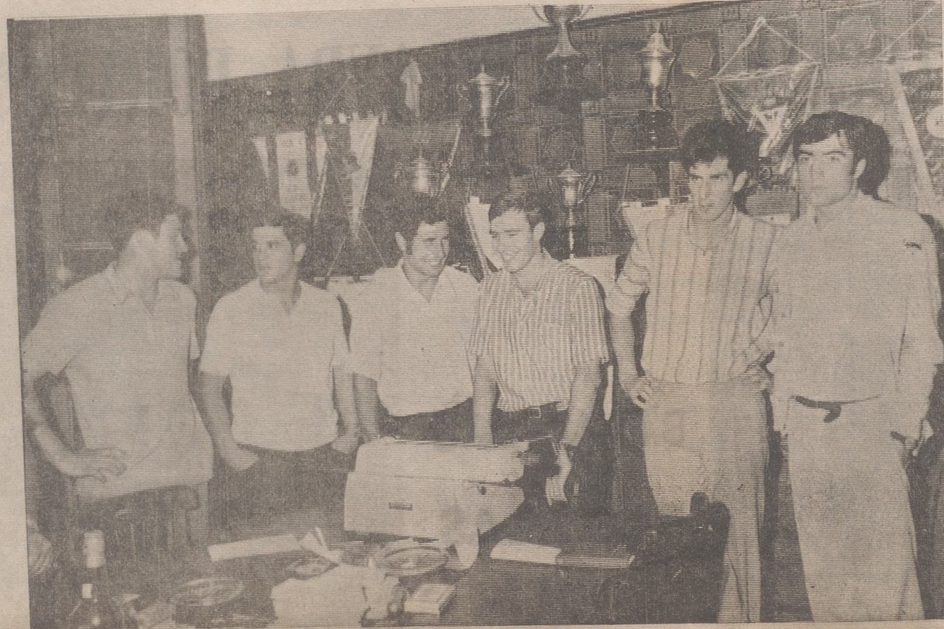
SE VIERON CARAS NUEVAS...