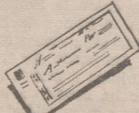
Bill of exchange «bil of excheinch»