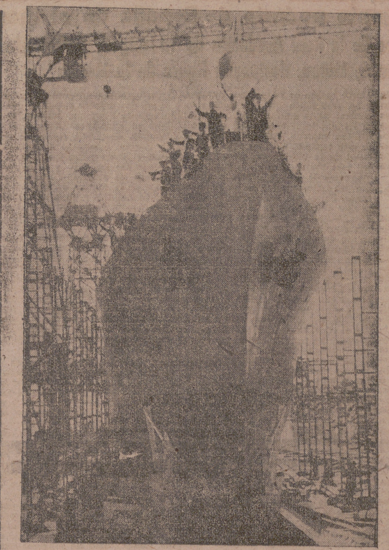
Botadura del cañonero «Hernán Cortés», en El Ferrol, un nuevo barco de guerra construido en los astilleros españoles.

El primer lugar, destacado, en eficacia de producción de buques mercantes, le cabe a la región vizcaína, con sus dos grandes constructoras: la Euskalduna, en la que trabajan unos cuatro mil obreros especializados y técnicos y cuyas dependencias