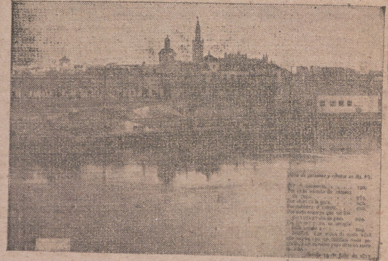
El Guadalquivir a su paso por Sevilla y al fondo la Giralda. Por estas mismas aguas navegó por primera vez, el día de la Virgen del Carmen, de 1817, el primer barco español de vapor, rumbo a Sanlúcar. En la parte inferior derecha de la fotografía, la lista de precios de primitivo vapor.

Ahora hace justamente 128 años que los sevillanos se vieron sorpre- didos ante el primer barco de vapor que con bandera española empezaba a navegar, en este caso por el tran- quilo Guadalquivir, con su fea chi- mena echando un gran torrente de humo y con su amenazadora caldera hirviendo los sobrosales de los 100 y pico atrevidos pasajeros que iban de Sevilla a Sanlúcar.