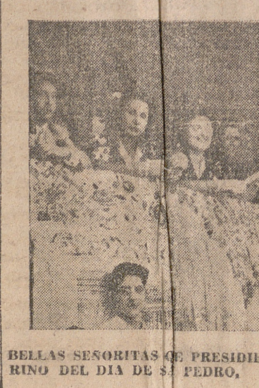
BELLAS SEÑORITAS QUE PRESIDEN EN HARO EL FESTIVAL TADRINO DEL DIA DE SAN PEDRO.

Cumplida esta presentación protocolaria, la muchedumbre se precipita en desbordado alud por la calle de la Vega; hacia el otro taurino, donde han de soltar, para artistas y valientes, buena colección de vacas bravas, y ha de celebrarse luego la novillada. Otro de los hilos de nuestras viejas tradiciones conduce ahora a este pueblo niño, que se expansiona ruidosamente en la Haro bulliciosa de conocida fama: El hilo de nuestra tradición más nuestra y más castiza: La lidia de toros: La fiesta nacional, Haro, 29 de junio de 1946.