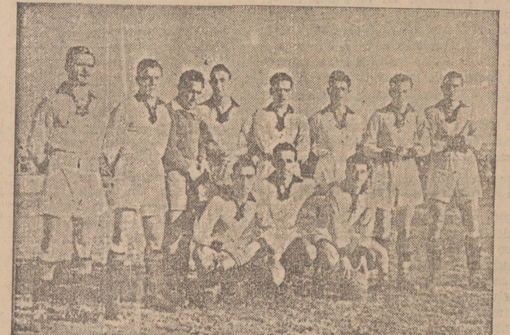
El Maestranta, que sigue adelante en la Copa de S. E. el Generalísimo.

Mardones se interna y suelta una (Pasa a la tercera página)