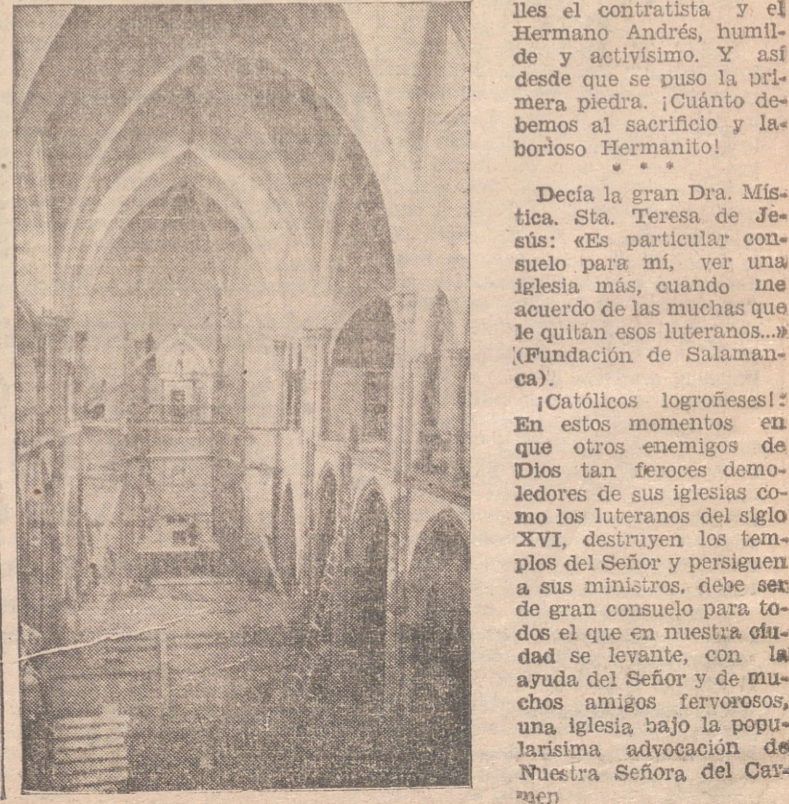
Decía la gran Dra. Mística. Sta. Teresa de Jesús: «Es particular consuelo para mí, ver una iglesia más, cuando me acuerdo de las muchas que le quitan esos luteranos.» (Fundación de Salamanca.) ¡Católicos logroñeses! En estos momentos en que otros enemigos de Dios tan feroces demolidores de sus iglesias como los luteranos del siglo XVI, destruyen los templos del Señor y persiguen a sus ministros, debe ser de gran consuelo para todos el que en nuestra ciudad se levante, con la ayuda del Señor y de muchos amigos fervorosos, una iglesia bajo la populárista advocación de Nuestra Señora del Carmen.