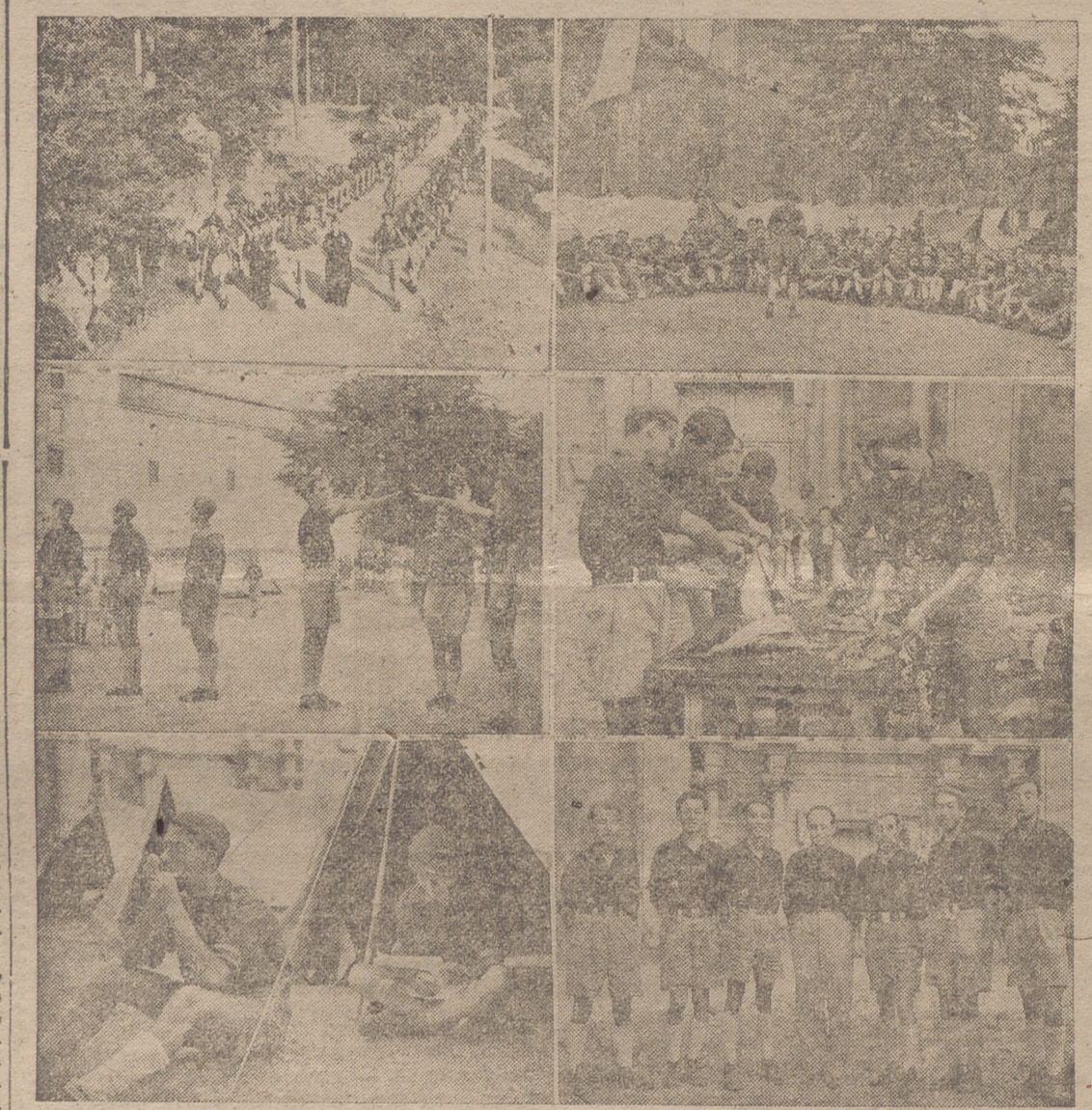
LA MARCHA DEL CAMPAMENTO NACIONAL «FRANCISCO FRANCO» HACIA LOGROÑO

Con extraordinario entusiasmo se celebraron ayer en Nájera brillantes actos en homenaje a los jóvenes falangistas