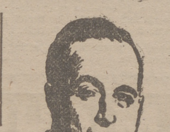
Este es siempre había expresado el deseo de ser enterrado en su pueblo de nacimiento.

El Gobierno anuncia que el cadáver de Getulio Vargas será embalsamado y llevado a Sao Borja, su ciudad natal, en el Estado de Rio Grande do Sul, en donde recibirá sepultura. Desde Sao Borja realizó Vargas su histórica marcha sobre Brasil en la revolución de 1930 que le llevó al Poder. Los familiares del presidente han di-