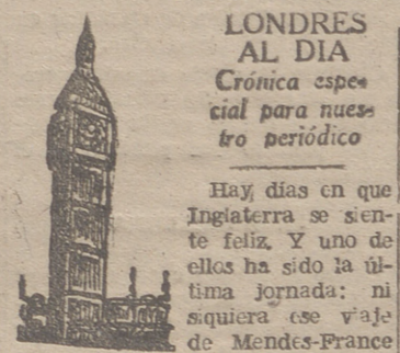
LONDRES AL DIA Crónica especial para nuestro periódico

Hay días en que Inglaterra se siente feliz. Y uno de ellos ha sido la última jornada: ni siquiera ese viaje de Mendes-France pidiendo áfrica a Churchill, ni las indignaciones a estilo chino de Mr. Attlee demandando una coexistencia pacífica por el mundo rojo, turban el buen estado de ánimo de las gentes de este país.