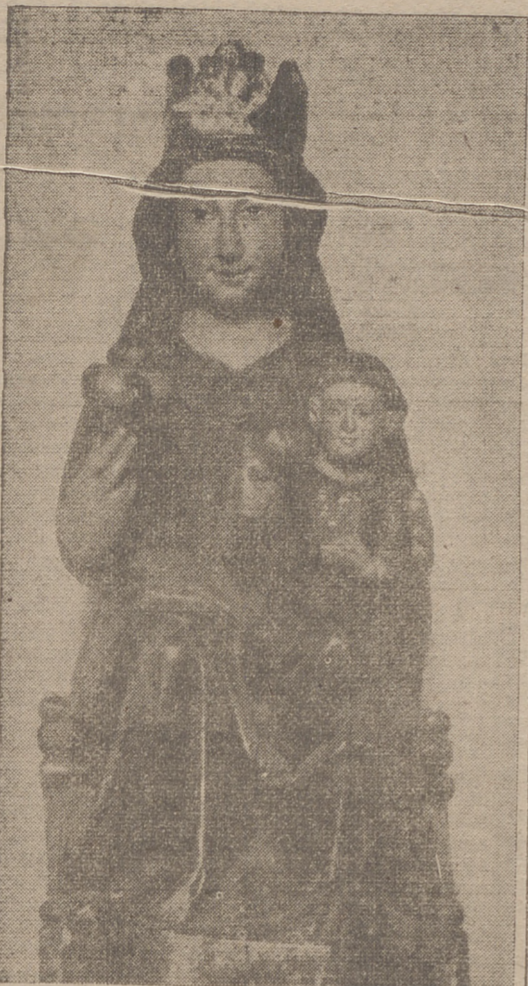
Trasladada procesionalmente al pueblo, entre aclamaciones de gratitud y regocijo, le fué dedicada una modesta capilla, en espera de poder levantarle un decoroso y espléndido templo. Desde entonces comenzó a ser apreciada con el título de Nuestra Señora de Tres Fuentes, que quizás porque eran tres las fuentes que manaban en el lugar de la aparición.

Desapareció la Reina de los Cielos, pero no desaparecieron del rostro de la niña las bellísimas huellas que habían dejado marcadas los dedos virginales de María.