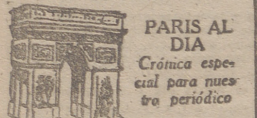
PARIS AL DIA Cronica especial para nuestro periódico

EL CONDE DE PARIS ABANDONA EL CRUCERO DE LAS 104 ALTEZAS POR EL DIARIO OFICIAL