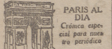
PARIS AL DIA Cronica especial para nuestro periódico

EL MUNDO ENTERO CONTEMPLE CON ESCÉPTICISMO COMO SE AGITA FRANCIA EN ESOS DISCURSOS PARLAMENTARIOS UTILES: LA C. E. D. ESTA ENTERRADA Y NO RESUCITARA