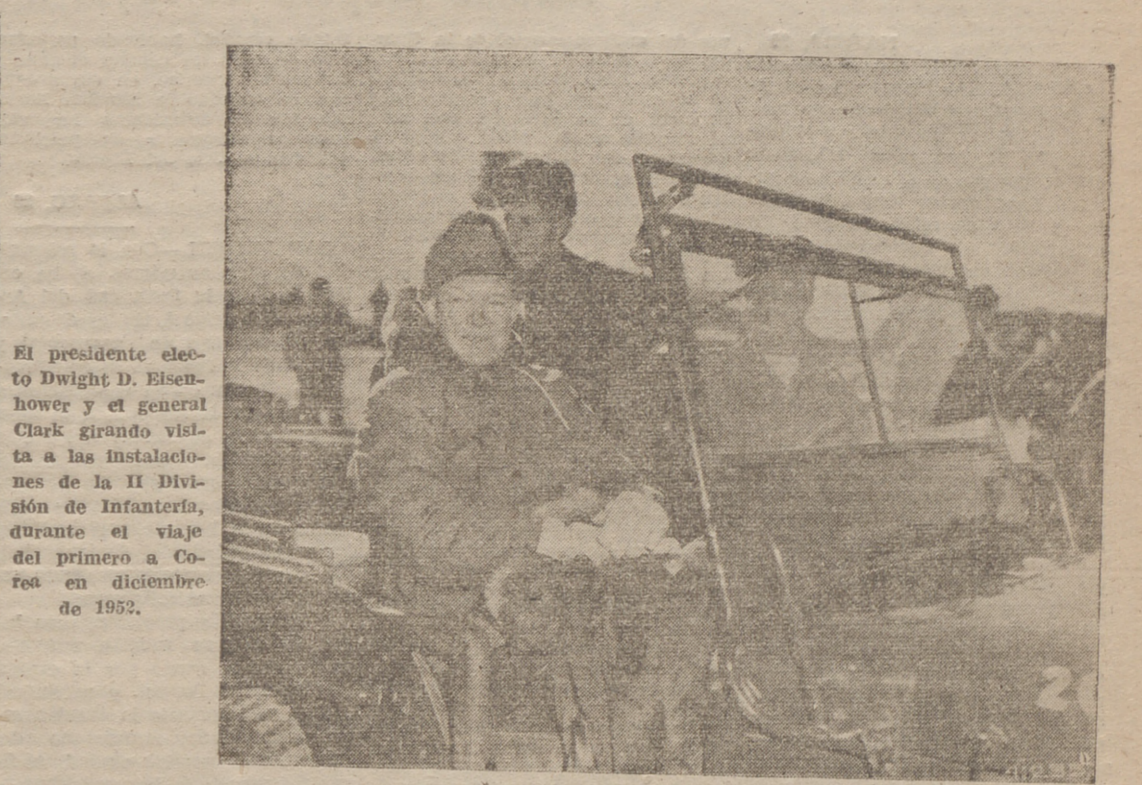
El presidente electo Dwight D. Eisenhower y el general Clark girando visita a las instalaciones de la II División de Infantería, durante el viaje del primero a Corea en diciembre de 1952.

La guerra de Corea durante la campaña presidencial de 1952 fue una de las cuestiones más importantes. El general Eisenhower, en su calidad de candidato republicano, había prometido, caso de ser elegido, que visitaría Corea antes que nada y que buscaría la manera de terminar aquella lucha. El 21 de noviembre recibí noticias de que Eisenhower, como presidente electo, venía a visitarnos. Los agentes del servicio secreto llegaron a Tokio pocos días antes de la fecha prevista para su desembarco en tierra coreana. La hora exacta, la fecha y el lugar, constituirían un hermetico secreto. Los agentes del servicio secreto y yo estudiamos el itinerario propuesto, que incluía breves visitas al Cuartel General del VIII Ejército, visitas a las unidades americanas y de la República de Corea que se encontraban en el frente, un alto en la base de un escuadrón bombardero y una visita a un hospital de sangre. También estaba prevista una visita a las unidades navales fondeadas en aquel mar, pero pronto se decidió que todos los jefes importantes de tierra, mar y aire se reunirían en el Cuartel General del VIII Ejército para discutir sus problemas con Eisenhower.