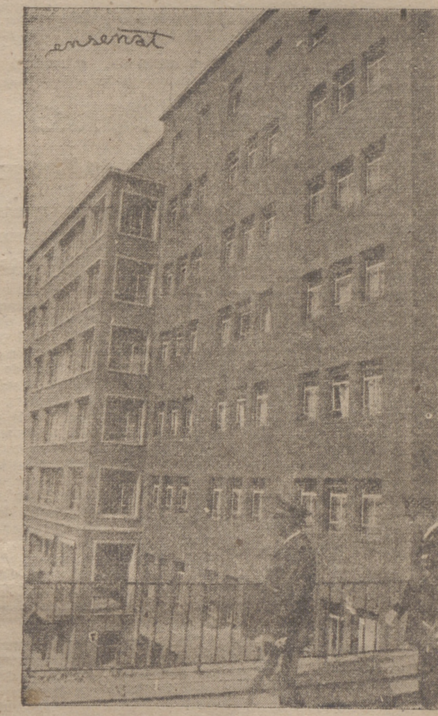
El Caudillo en el momento de salir de la magnífica Residencia Sanitaria del Seguro de Enfermedad, cuyas instalaciones visitó.

PROCESION DEL ROSARIO VITORIA, 16.— A las once de la noche comenzó a organizarse en la Plaza de la Virgen Blanca, la solemne procesión del Rosario o de los Paros, que recorrió diversas calles de la ciudad, que estaban a oscuras para dar más realce al cortejo, y, sobre todo, a la imagen de la Virgen, que iba iluminada por potentes reflectores. Un gentío inmenso presenció el paso de la Patrona, apodollándose con gran fervor. Desde uno de los balcones de la calle de Dato, admiró la esposa del Jefe del Estado, doña Carmen Polo de Franco, la belleza de la comitiva. También el nuncio de Su Santidad y demás prelados se hallaban en otros lugares de la misma céntrica calle, la más concurrida de pública, al extremo de que era casi imposible arrodiarse. La procesión llegó a las doce y media a la Plaza de España, y la imagen fué transportada de la carroza en que pasó triunfalmente por las calles, al trono levantado en dicho lugar, donde permanecerá hasta mañana. Inmediatamente comenzó una misa de comunión, al zire libre, oficiada por el obispo auxiliar de Zaragoza y Ocaña por millares de hombres y jóvenes. Durante la noche, la imagen de la Patrona está acompañada por fervientes vitorianos. Mañana, a las ocho y media, se dará la primera misa