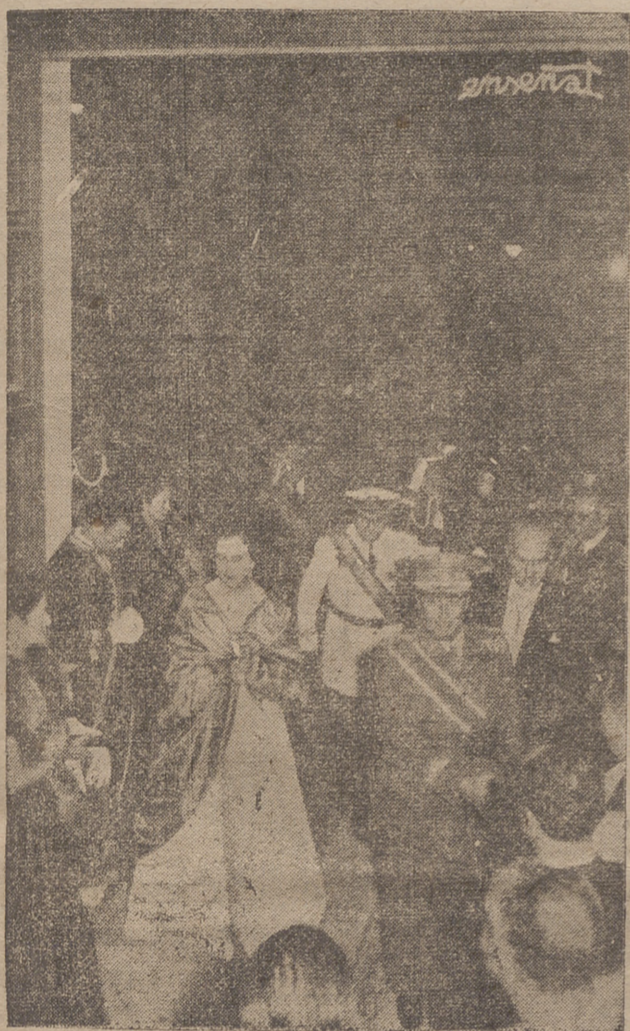
SS. EE. el Jefe del Estado y esposa, doña Carmen Polo de Franco, al llegar al Ayuntamiento logroñés para asistir a la cena de gala que le fué ofrecida por la Corporación Municipal.