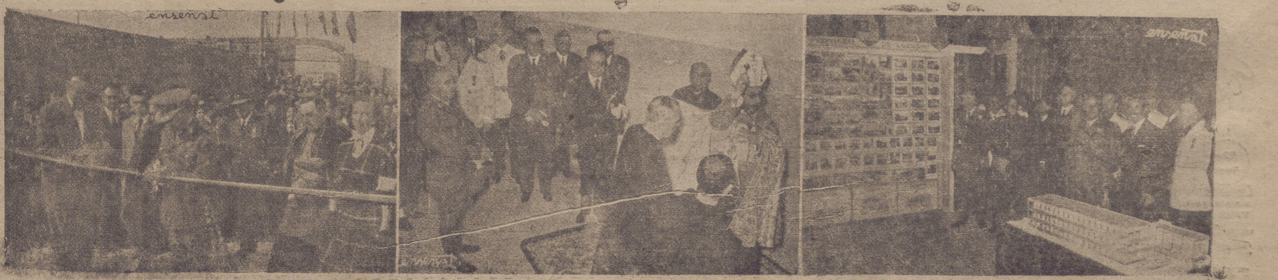
De izquierda a derecha: El Caudillo, en su visita a la obra de «Los Boscos», corta la cinta en la ceremonia inaugural del frontón construido por la misma. --- Momento de la bendición en el edificio del Instituto Provincial de Higiene. --- El Jefe del Estado examinando uno de los «stands» durante su visita a la exposición instalada en el Instituto de Enseñanza Media.