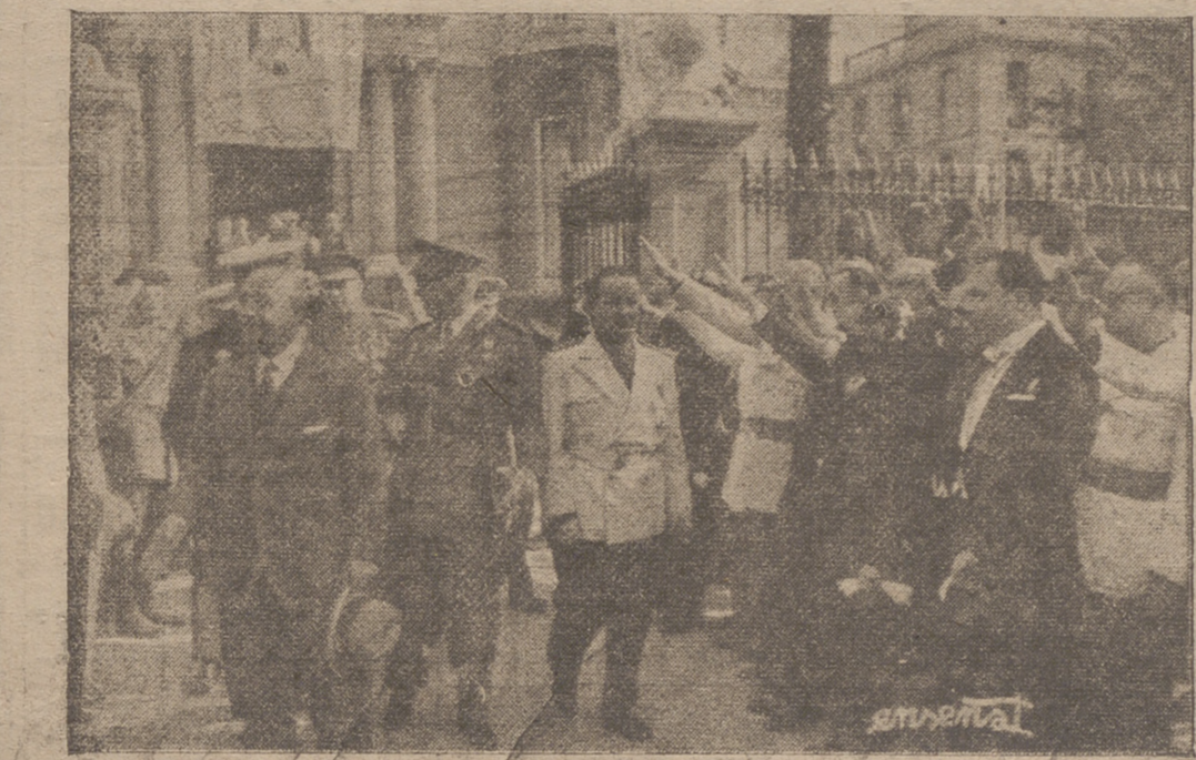
S. E. el Jefe del Estado abandona el Palacio de la Diputación Provincial al dar por finalizada su estancia en Logroño y emprender su viaje a Madrid.

El edificio consta de siete plantas. En las bajas están instalados