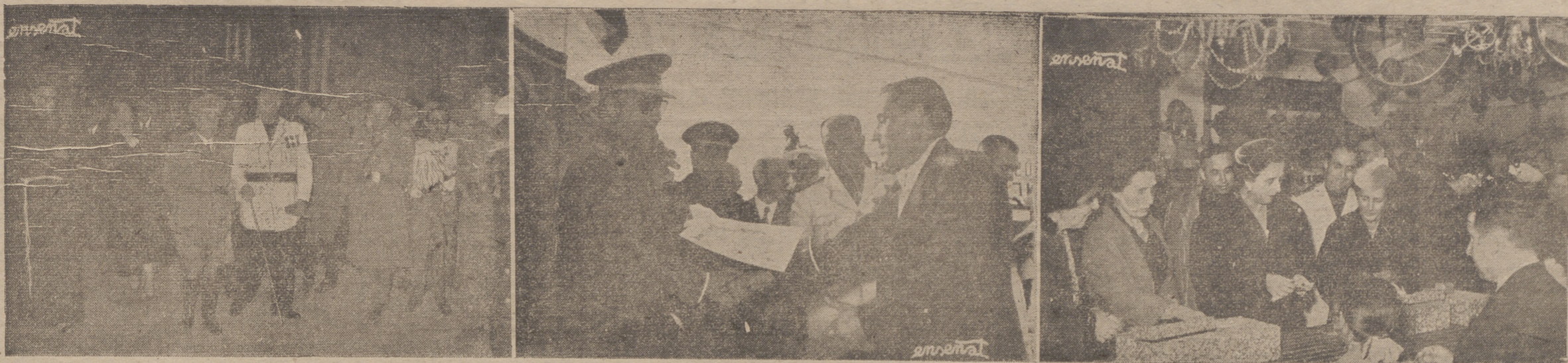
NOTAS GRAFICAS DE LA JORNADA DEL VIERNES. --- De izquierda a derecha: SS. EE. el Jefe del Estado y esposa visitando el Monasterio de Santa María la Real en Nájera. --- El Caudillo entrega los títulos de adjudicación de huertos familiares en Cenicero. --- Doña Carmen Polo de Franco expendieron boletos en la Tómbola del Secretariado de Caridad.