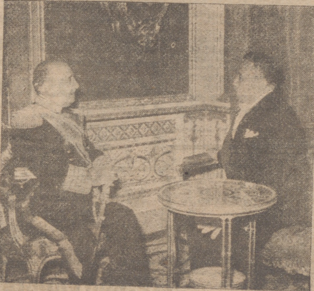
MADRID. — El nuevo embajador de Filipinas en España, don Pedro Sabido, conversa con S. E. el Jefe del Estado, después de la presentación de sus cartas credenciales en el Palacio de Oriente. — (Otra.)