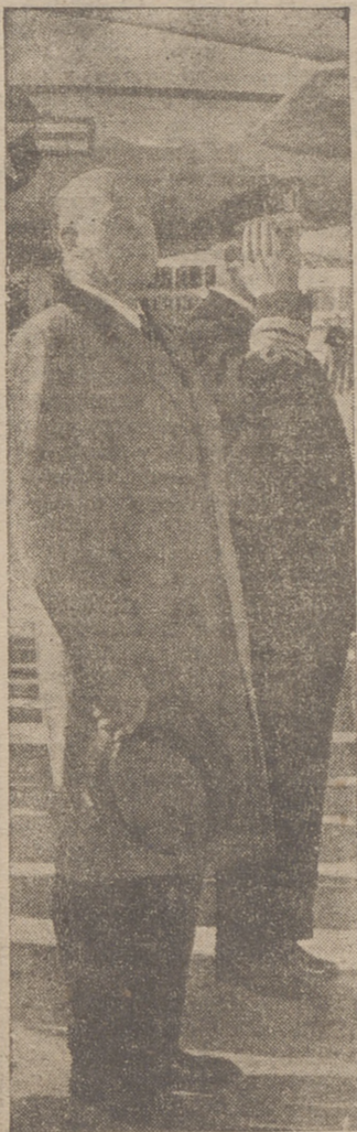
El secretario de Marina de los Estados Unidos, mister Charles Spark Thomas (de pañano), a su llegada al aeropuerto de Barajas.