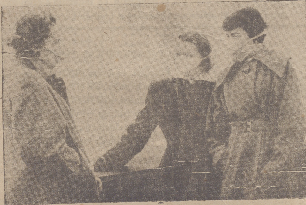
LONDRES. — La densa y locuza niebla que en tiempo frío envuelve a Londres ha hecho su aparición en el presente año. En algunos lugares era imposible ver a más de cinco yardas de distancia. Con este motivo, los habitantes de esta populosa ciudad han vuelto a tomar sus precauciones de año en año, tendiéndose con unas mascarillas que ya se venden en los comercios por millares. En la foto vemos a tres muchachas empacadas conversando de sus cosas junto a un puente sobre el Támesis antes de entrar en sus oficinas. — (Cifra).