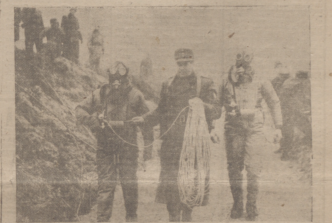
DONAUFORTH.—Un momento de las maniobras realizadas en Baviera por los miembros de la Policía de fronteras de Alemania Occidental, en las que han participado doce mil hombres y dos mil quinientos vehículos. Este despliegue de fuerzas alemanas ha sido el mayor de los realizados por dicha Policía, que cuenta cuatro años de antigüedad.