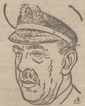
(Información en octava pág.)

La Medalla de Oro de la Juventud, al ministro de Marina Fué creador de la Sección Naval del Frente de Juventudes