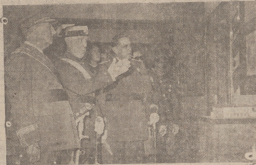
bandera donada por el Caudillo y en cuya ceremonia actuó de madrina su esposa, doña Carmen Polo de Franco.

MADRID. — S. E. el Jefe del Estado, acompañado de varios ministros del Gobierno, de los presidentes de las Cortes y del Consejo de Estado, del director general de la Guardia Civil y otras personalidades, durante su visita a las dependencias de la nueva Academia Especial del Benemérito Cuerpo, con motivo de la entrega de la bandera donada por el Caudillo y en cuya ceremonia actuó de madrina su esposa, doña Carmen Polo de Franco.