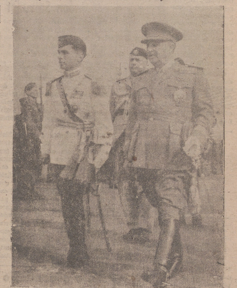
MADRID.—El rey Hussein de Jordania, acompañado de S. E. el Jefe del Estado, Generalísimo Franco, pasa revista a las fuerzas que le rindieron honores a su llegada al aeropuerto de Barajas.

Ante el edificio del Museo se había congregado una gran multitud de público, que renovó las cariñosas manifestaciones de simpatía a los reyes de Jordania, ovacionándoles largamente.