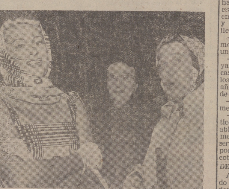
La bella artista francesa Martín Carol ha regresado de nuevo a París después de un viaje de 80 días por varios puntos de Europa. En la foto, Martín Carol a su llegada al aeropuerto de Orly con su madre y su madre política, que fueron a recibirla.