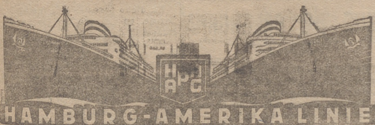
(COMPANIA HAMBURGUESA AMERICANA)