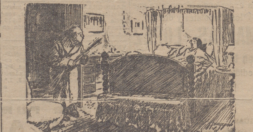
El marido (que se ha levantado de la cama al advertir que hay ladrones escobilla de limpiar la escopeta? (De "London Opinión")

A los efectos de esta disposición, se considerará como desplazamiento aéreo remunerable el efectuado entre aeródromos situados a más de setenta kilómetros, ejercicios tácticos de dos horas de duración, o, en los casos especiales, que previa la autorización del jefe de Aviación, puedan efectuarse.