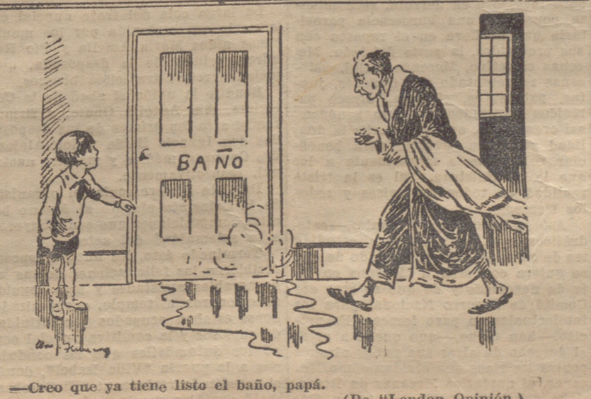
—Creo que ya tiene listo el baño, papá. (De "Jondon Opinión.")

Aunque la República diera de lado a sus compromisos quedarían estos en pie. Si así ocurriera, si todo el poder legal de la República no fuera bastante a garantizar un derecho mínimo de existencia, nadie puede luego esperar que reviviera su fe republicana, soportando con el fuelle de la retórica en las cenizas de la decepción".