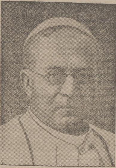
S. S. Pío XI, Pontifex Romanus