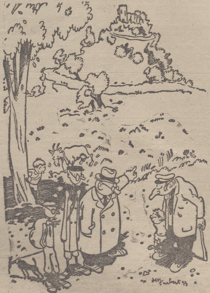
EL FORASTERO.—¿Tiene algo interesante que ver ese castillo? —No puedo decirlo; yo soy de aquí.

—Este año se notaba que había gran abundancia de truchas en los ríos Irreña y Najerilla. El precio general de dicha pesca en los pueblos donde se cogía, era de 250 pesetas el kilo y en algunos a dos.