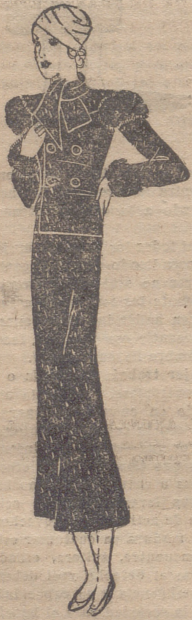
Traje sastre de gruesa lana negra moeda de blanco y rojo. La chaqueta cruzada lleva cuatro botones negros y rojos

¿Qué hacer de los pequeños durante los viajes? Mrs. Thayer ha resuelto esta gran dificultad creando en su hotel un nuevo servicio. Dos grandes salones repletos de juguetes, la gruta del oso Fiddy y una terraza techada en el piso 17 para que los juegos al