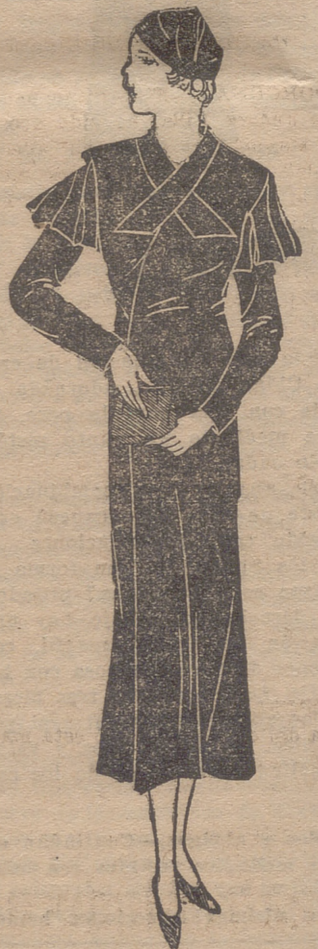
Gabán de lana negra ajustado al talle. Cuello prolongado en dos puntas cruzadas.

da mucho: el hinojo. Las hojas finísimas de esta herbácea, tienen un olor muy agradable y hay una especie que sirve para comerla en forma de ensalada. Para las personas que padecen trastornos de carácter diatélico es de muy buenos resultados, como asimismo para las que sufren anemia, el uso de un vino de hinojo que se prepara sencillamente poniendo en maceración sesenta gramos de hojitas de esta planta en medio litro