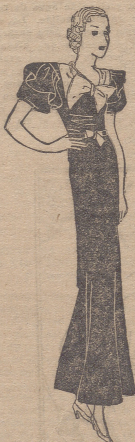
Traje de crêpe cirnos violeta. El cuello de "crêpe Georgette" morado pálido, adornado con un lazo del mismo tejido. Volantes fruncido encima de la manga "abullonada". El cinturón del tejido del traje está anudado con Georgette morado.

"Siempre he creído que ninguna mujer puede ser realmente hermosa