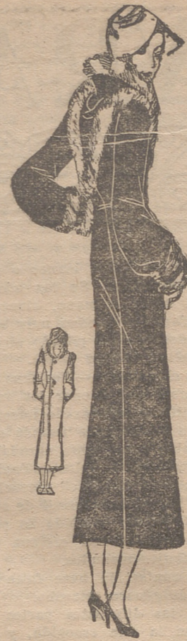
Abriego rojo vivo adornado con piel de guanaco negro, que dibuja en la espalda una V

La mujer no quiere ser engañada; pero busca de que se llegos hasta su corazón mediante engaños.