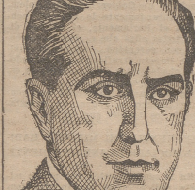
El doctor Marañón

A las tres y media de la tarde, el doctor Marañón reanudó las gestiones que le había encomendado el presidente de la República.