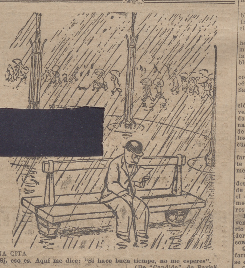
UNA CITA —Si, eso es. Aquí me dice: "Si hace buen tiempo, no me esperes". (De "Candide", de Paris)