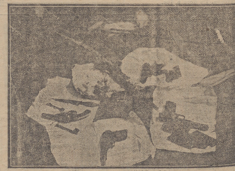
Las armas, prendas y utensilios recogidos a los pistoleros o hallados en las calles que éstos recorrieron en su huida.