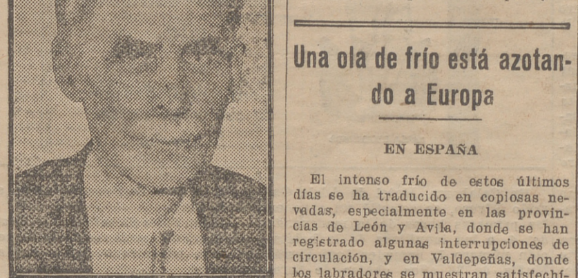
Mr. VOLSTEAD Autor de la "ley seca" que desde ayer ha quedado abolida