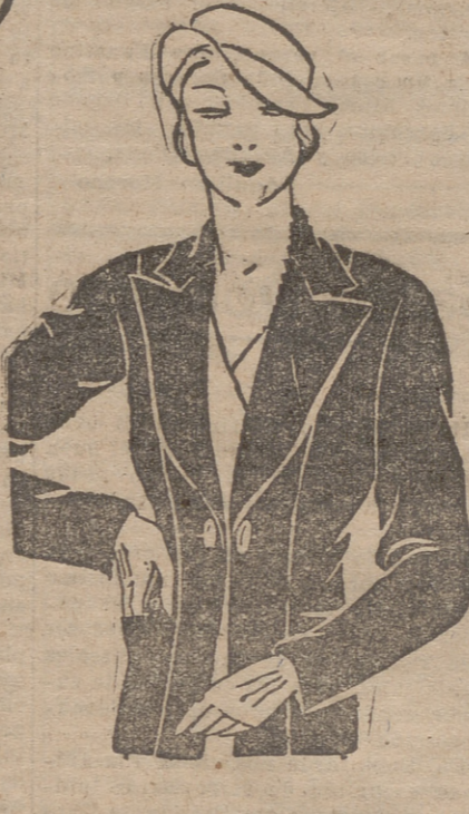
Chaqueta de crepé grueso negro, sobre un chaleco de otomán blanco