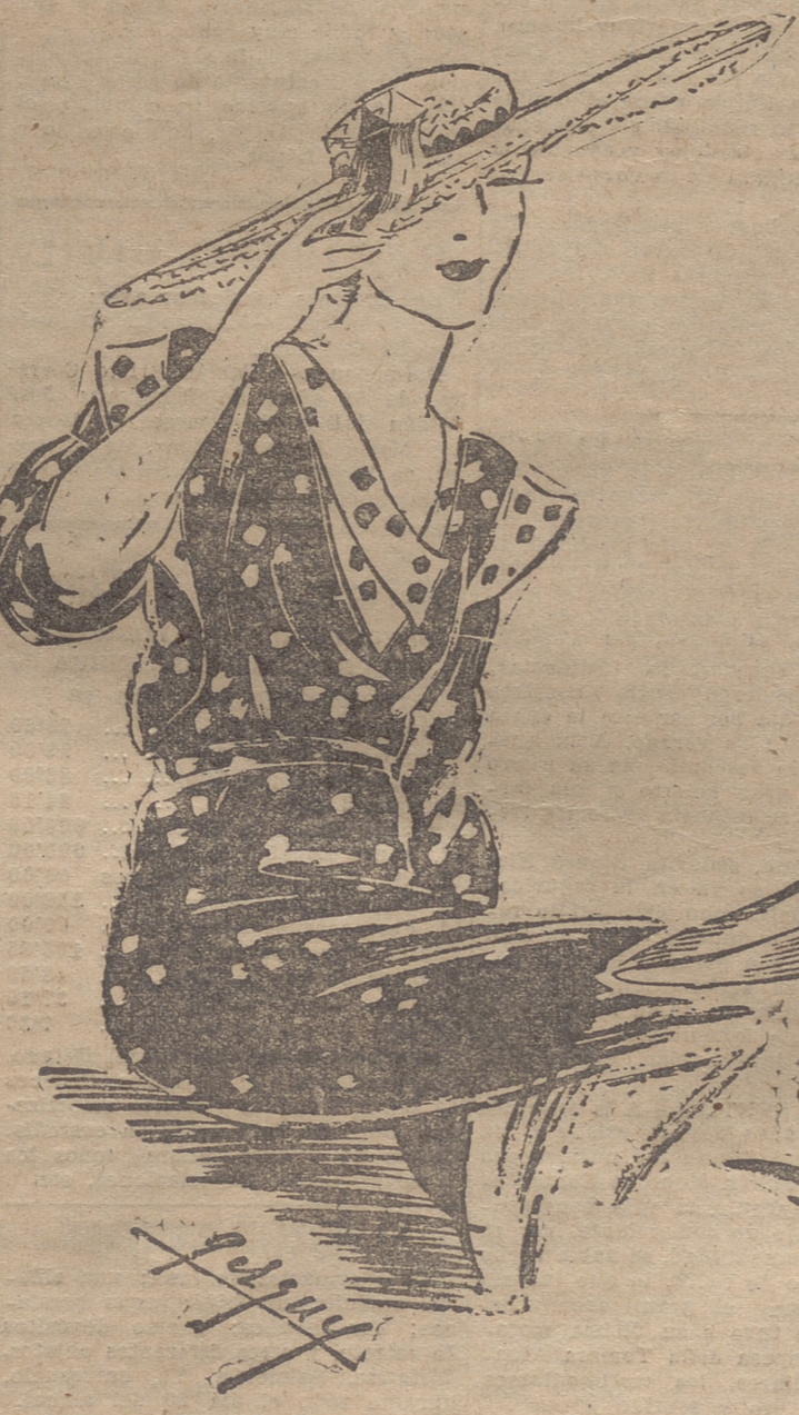
Sombrero de paja gruesa blanca, adornado con terciopelo rojo. — Vestido de crepé de seda natural con impresiones de lunares rojos y azules. — Sombrero de paja de Italia natural, adornado con grosgrain castaño. — Sombrerito de fieltro negro, adornado con un lazo de satén.

pero proteja su piel con aceites y cremas especiales. Perfumería VIUDA DE ELIZONDO. TELEFONO 1758