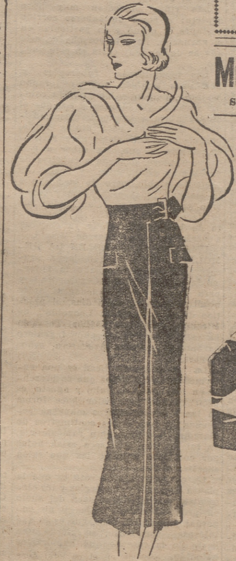
Falda de crepé grueso negro y blusa de organdí blanco

En el curso del embarazo las secreciones venenosas que produce el organismo de la madre y el del ser embrionario, pueden originar también, como sucede frecuentemente, graves intoxicaciones a la menor alteración alimenticia. Las primeras, las de la madre, provienen generalmente de un origen intestinal; las otras de la nutrición del embrión, secreción fetal, verdaderas albúminas de extraña composición que penetran en el organismo maternal y lo intoxican. Estos venenos interiores son tanto más nocivos cuanto peor eliminados son, como sucede en los casos de embarazo anormal, insuficiencia—hepática o renal. Por consecuencia de todas estas