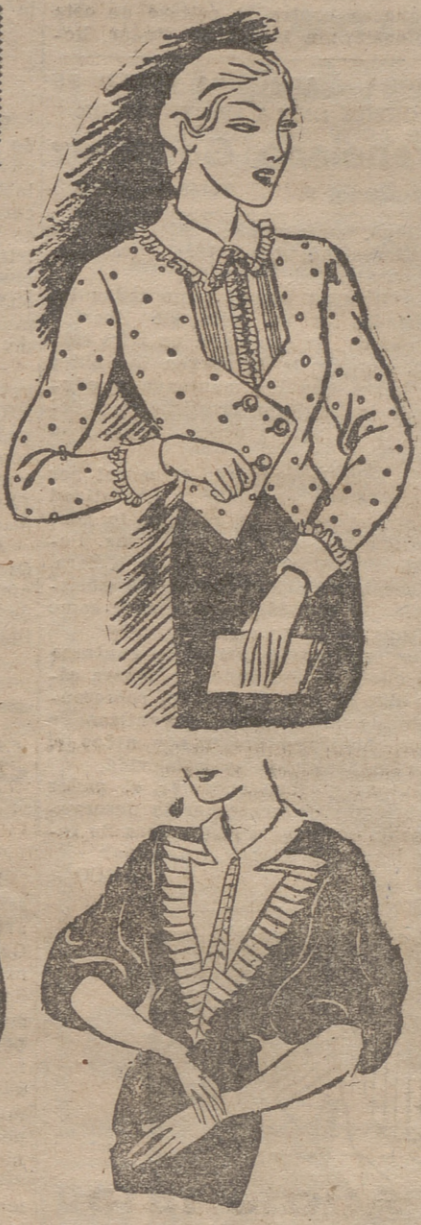
Blusa de tafetas blanco con lunares rojos, adornada con un plisado y pecherito de organdí blanco Blusa de jersey azul, adornado con crepé color paja

razones, la alimentación de la mujer en cinta no debe ser, en ningún caso, para su delicado y maternal organismo, una nueva causa de intoxicación o de irritación del hígado y los riñones. Por las mismas razones las futuras mamás deberán evitar y combatir con sumo cuidado los catarris y otras afecciones de carácter gripal. No son alimentos adecuados para ellas, la caza, los embutidos (salvo los netamente puros y sin especias en demasia, de lomo y jamón), las conservas y, de una manera general, los excesos de carne. De la misma forma las futuras madres deberán evi-