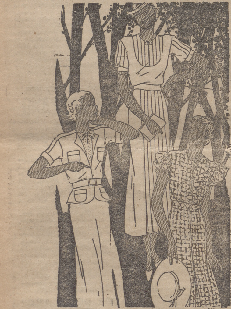
Traje de "shantung" blanco. Chaqueta adornada por pequeños bolsillos. Vestido en crepe de China blanco. La pleguera, la parte superior de las mangas y el delantero de la falda llevan pliegues. Vestido de crepón blanco cuadrado. Mangas avolantadas. Chorrera ondulada.

de la subsistencia, a todos los pobladores de un país. Considerando al hombre capaz de subvenir por su propio esfuerzo y por su libre albedrío a su mantenimiento, no legisló más que para los seres débiles. La mujer y el niño son seres débiles aunque se ofendan las feministas. Lo son y lo han sido siempre hasta aquí. Que traten de sacudir las mujeres su debilidad y aspiren a ser fuertes como el hombre, es un deseo muy lógico y muy legítimo. Pero a ellas mismas no se les puede ocultar que semejante ideal no es asequible mientras las sociedades no se reorganicen económicamente de tal forma, que no haya nadie sin derecho al tra-