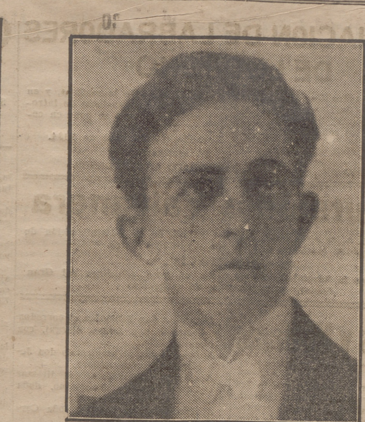
EL ILUSIONISTA BARON VON REINHALT

Hace constar que el verdadero pan "equilibrado" es el moreno, único que contiene todos los elementos que forman un alimento completo.