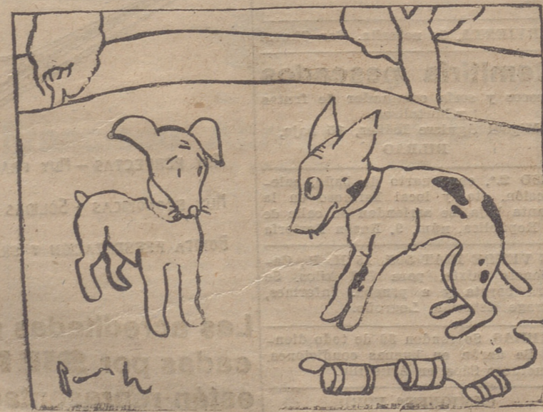
—Y tú, ¿por qué me miras con esa cara de perro? ¿Te debe algo?